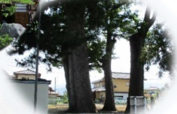
巨木がある神社・寺が多い

長野県一大きい延命大仏！伊勢神宮にゆかりのある伊勢社！推古天皇が創建したとされる世茂井神社！古い所と近代的なまちの混在する魅力的な川中島。