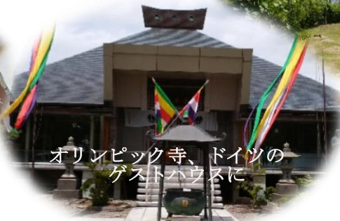
オリンピック寺、ドイツの ゲストハウスに