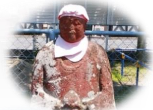
↑赤い顔のお地藏さん