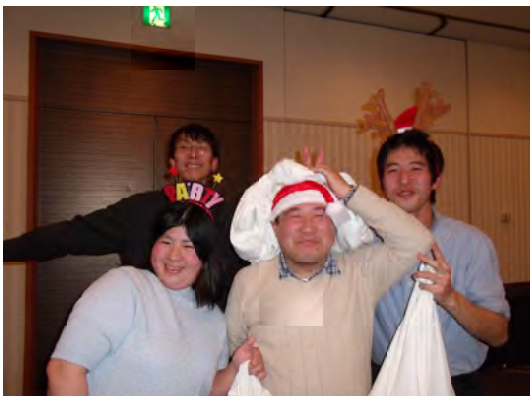
サンタと一緒に記念撮影

「あるとぴのアンサンブル」の方たちが、列車と旅が大好きなみんなのために、関連した曲を何曲か演奏し、会が始まりました。途中、サンタクロースも現れて全員にプレゼント。みんなの笑顔がますます大きくなります。「昨年の東北の旅は感動して泣きました」「京都、お伊勢様、鳥取の砂丘に行つてラクダに乗りたいたい」「10代でやったひまわり号のボランティア、27歳になった今やってみたら身体が覚えていた。スキルアップしてこれからはがんばりたい」。みんなの夢はますます広がります。今年の旅も「福島のハワイアンズきづなりリゾート」に決定