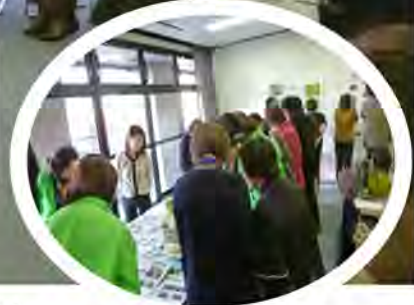
写真や作品を持ち寄って

園芸福祉の活動には肥料や苗を用意するのに資金が必要だったり、メンバーの高齢化だったり…グループで抱えている課題や活動の様子もざっくばらんに話し合いました。