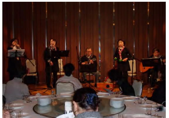
あるとぴのアンサンブルの演奏です！

さまざまな障がいをもつ人たちの夢と希望を列車に乗せて、障がい者も健常者も垣根なくともに旅する「長野『ひまわり号』の会」。 私は昨年初めて参加し、50歳代の視覚に障がいのある女性の方と、それこそ本当に手と手を取り合いながら一泊二日の「東北の旅」を満喫してきました。最初の不安はどこへやら、存分に楽しんでる自分がいました。 その会が今年30周年を迎えるということで、昨年の12月22日、プレイベントとして大忘年会を開きました。 なんと総勢50人！