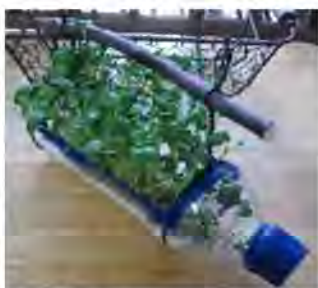
ペットボトルを用いて、スプラウト作り